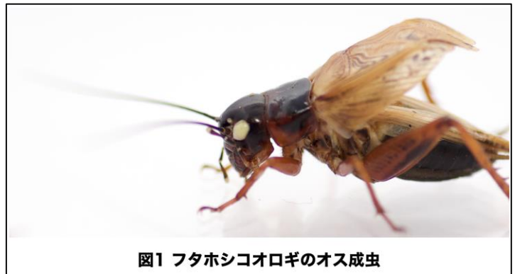
図1 フタホシコオロギのオス成虫

そんな中、発生生物学や分子生物学分野の進展と、それに伴う遺伝子解析技術の発展により、1990年代から、現存する生物の発生を分子レベルで比較することで生物進化のしくみの解明を目指す進化発生学という分野が生まれました。最近20年の進化発生学の研究から、昆虫の翅の起源としては、古典的な2つの仮説の両方が部分的に正しいとする複合起源説が提唱され、議論は三つ巴の状態となっていました。翅の進化を理解する上で、化石証拠に頼ることができない状況の中で、進化発生学によるアプローチは非常に有効です。しかし、従来研究のモデルとして使用されていた昆虫は、昆虫の系統において派生的な完全変態昆虫（注1）に偏っていました。しかしながら、最初に翅を獲得して空を飛んだ昆虫は、より祖先的な発生様式を示す不完全変態昆虫（注1）であったことに疑いはありません。蛹の段階を経て成虫へと変態する完全変態昆虫と、成虫によく似た姿で生まれてくる不完全変態昆虫との間では発生のしくみに大きな違いがあります。翅の進化機構を理解するためには、翅を持たない祖先的な昆虫と比較して不完全変態昆虫の翅づくりのしくみを知る必要があります。そこで本研究では、不完全変態昆虫であるフタホシコオロギ（図1）をモデルとして、翅がどこからどのように作られるのか、そのしくみを明らかにすることを目指しました。