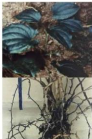
プラエヘンシリシ ヤマノイモ(熱帯雨林)