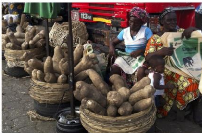
ヤム市場のギニアヤム(西アフリカ、ベニン)

本成果は、2020年12月3日に米国の国際学術誌「米国科学アカデミー紀要」にオンライン掲載されました。