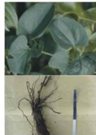
アビシニカ ヤマノイモ(サバンナ)