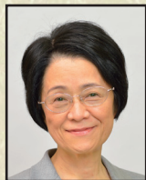
稲葉 カヨ ・京都大学理事・副学長、 生命科学研究所教授