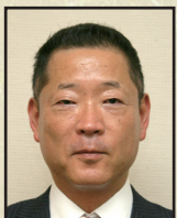
城福 健陽 ・京都府副知事