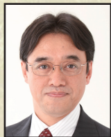
溝端 佐登史 ・京都大学 経済研究所長・教授