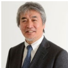
山極 壽一 京都大学 総長

1990年京都大学工学部交通土木工学科卒業。サンパウロ大学工科大学院（EPUSP）修士課程修了（1994年）。京都大学博士（工学）（1999年）。財団法人国際湖沼環境委員会研究員、国連環境計画（UNEP）協力企画官、京都大学工学研究科助手、日本大学理工学部講師・准教授、東京大学理学部講師、海洋研究開発機構招聘主任研究員、京都大学防災研究所准教授、同大学院総合生存学館准教授などを経て現職。国連地球環境監視システム淡水部門（GEMS/Water）のアドバイザー。JICA-JSPS 専門家派遣にてブラジル国立宇宙研究所気象気候予測研究センター（INPE-CPTEC）に派遣、サンパウロ大学サンカルロス校客員教授となる（2010年）。地球規模課題対応国際科学技術協力プログラム（SATREPS）を通じてクロアチア国の土砂災害防災計画に関わる。水環境学会技術賞（2001年）、水文・水資源学会論文賞（2014年）などを受賞。2015年から2017年まで国連教育文化機関国際水文プログラム国際水質イニシャティブ（UNESCO-IHP/IIWQ）専門家会議議長、2015年京都でのUNESCO水質専門家会議を主催する。2015年より系外惑星データベースExoKyotoを開発（ http://www.exoplanetkyoto.org ）する。2019年、土井宇宙飛行士、寺田准教授らとともに、アリゾナ大学人工隔離生態系Biosphere2を用いたスペースキャンプ（SCB2）を企画、実践する。