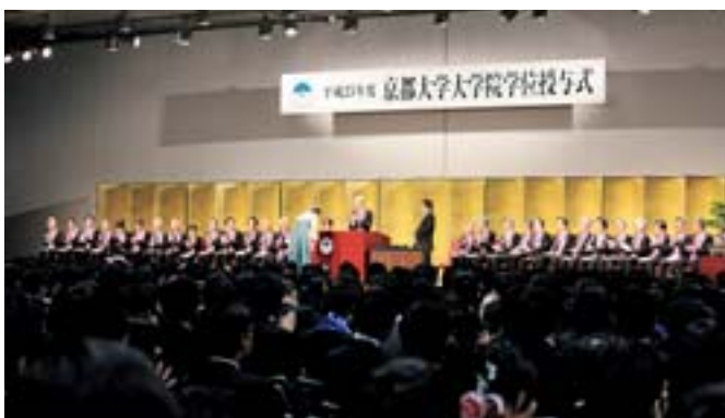
大学院学位授与式