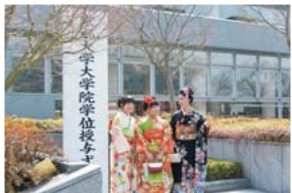
大学院学位授与式