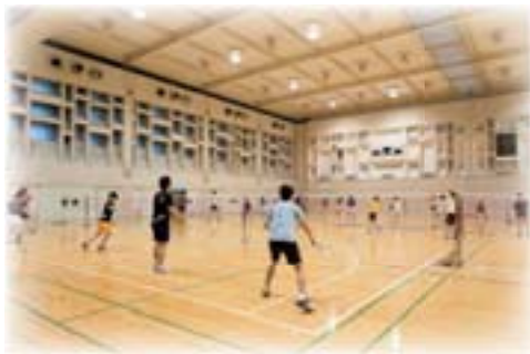
バドミントン部練習の様子