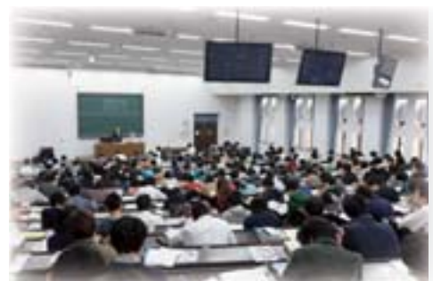
法学部「民法第一部」の授業風景