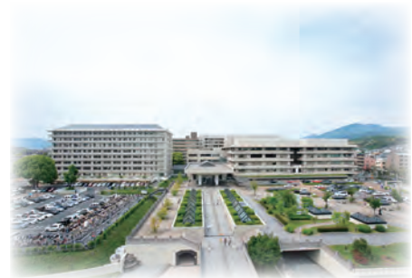
医学部附属病院外観