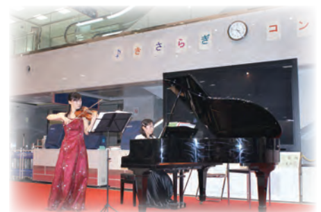
きさらぎコンサート