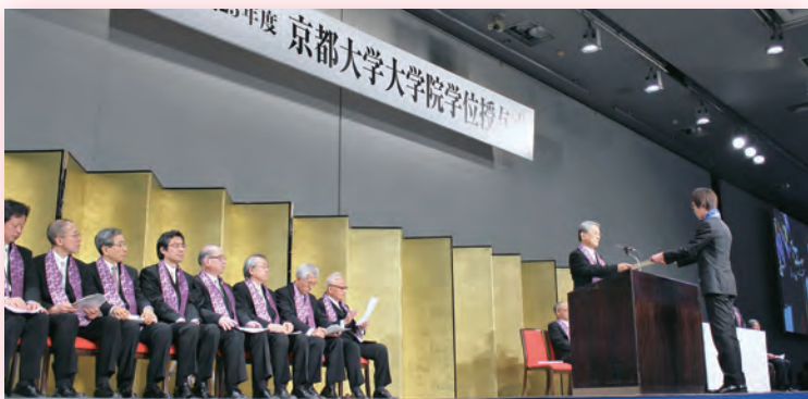
大学院学位授与式