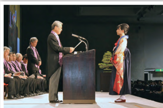
大学院学位授与式