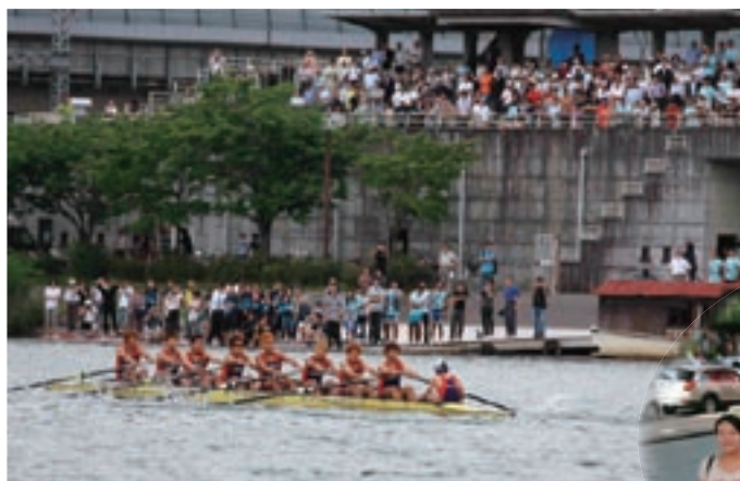
力漕する京大エイト