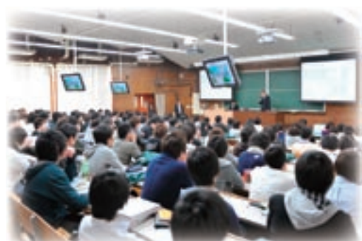
新入生ガイダンス