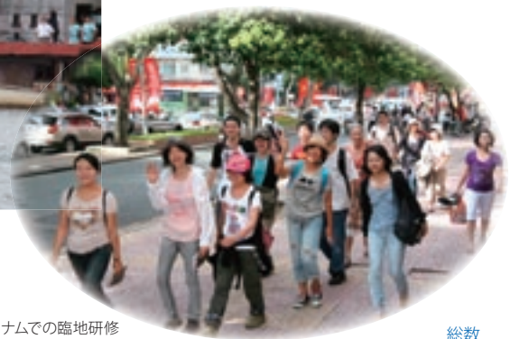
ベトナムでの臨地研修