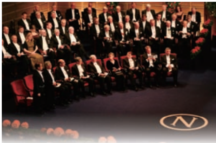
ノーベル賞授賞式