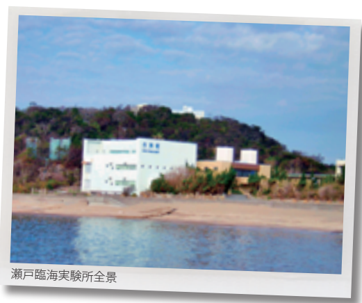
瀬戸臨海実験所全景