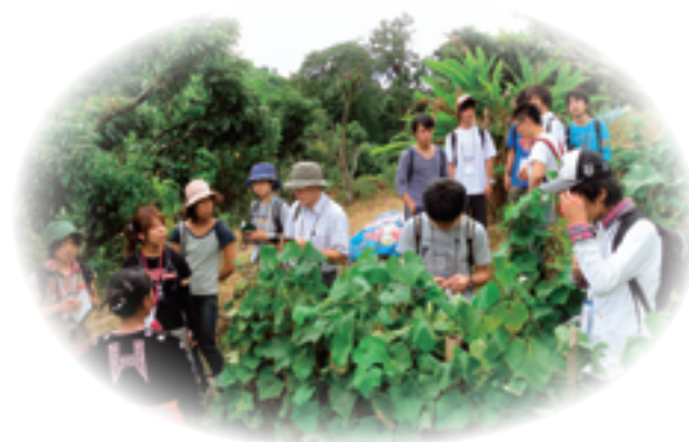
北タイ・モンの村のハヤトウリ畑での研修