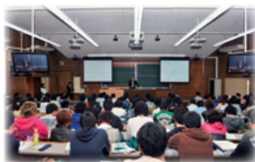
新入生ガイダンス