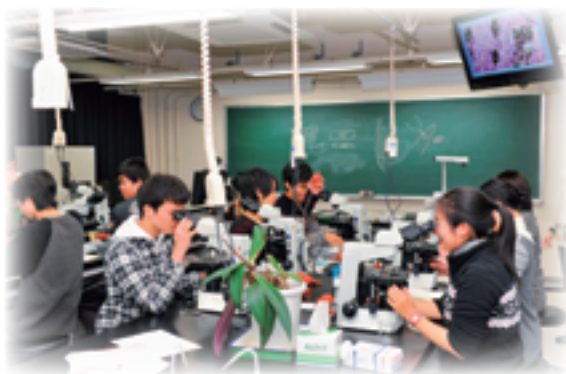
顕微鏡を使った生物学実習