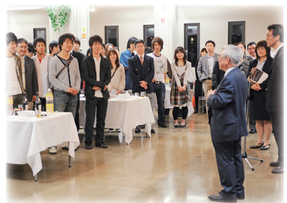
益川敏英名誉教授ノーベル物理学賞受賞記念講演会終了後の交流会

(注) 【 】 書きは社会人特別選抜(大学院設置基準14条特例を含む)による入学者数で内数