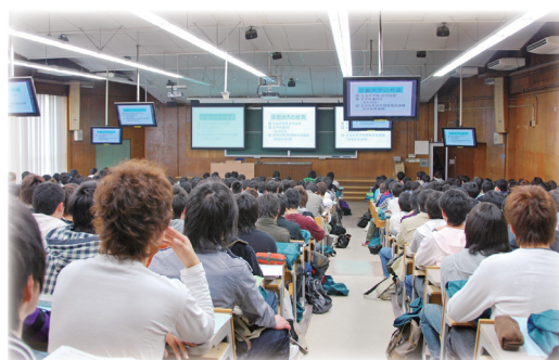
新入生ガイダンス