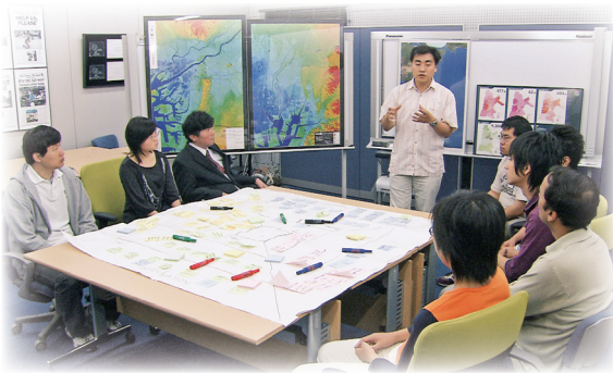
参加型ワークショップ (防災研究所)