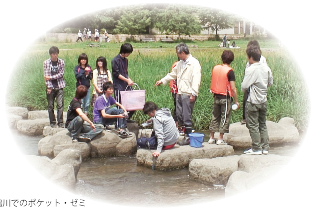
鴨川でのポケット・ゼミ