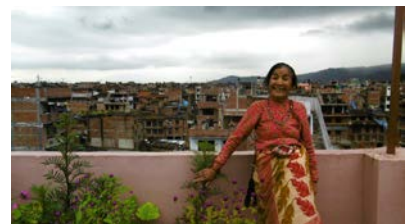
家に入れてくれたアママ(お母さん)