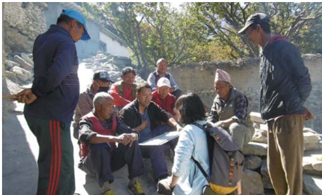
村人へのヒアリング