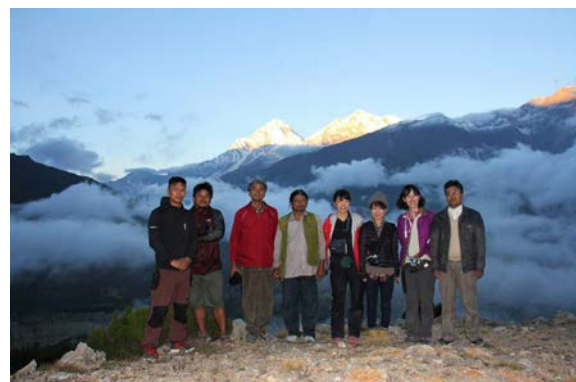
調査チーム集合写真