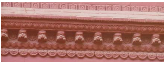
ファッション化した伝統意匠