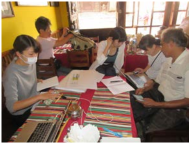
Pant 先生、奈良女子大学の学生と調査の打ち合わせ