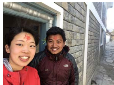
お祭りのティカをつけてもらう