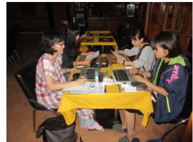
奈良女子大学の学生と Thini に関する勉強会