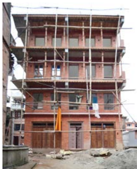
震災後の新築（A地区）