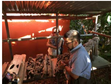
JICA 修復現場見学（カトマンズ）