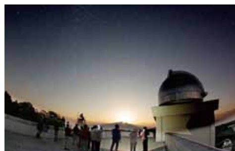
市民を対象とした「飛騨天文台 自然再発見ツアー」