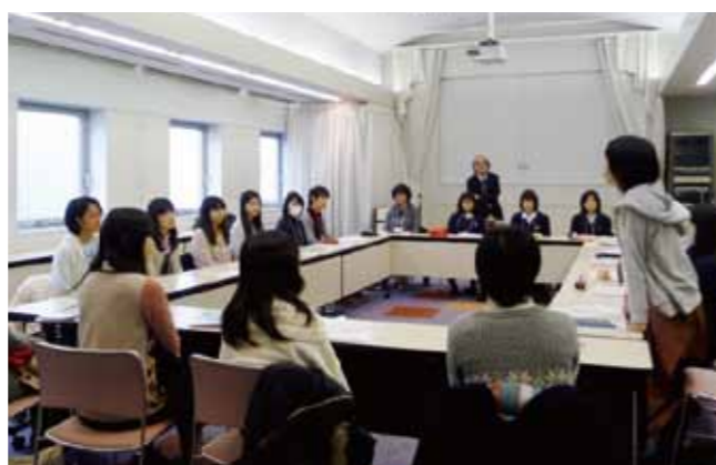
女子高生・車座フォーラム