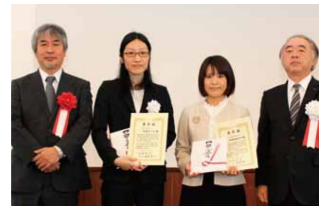
京都大学たちばな賞(優秀女性研究者賞)