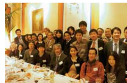
欧州洛友会(欧州同窓会)