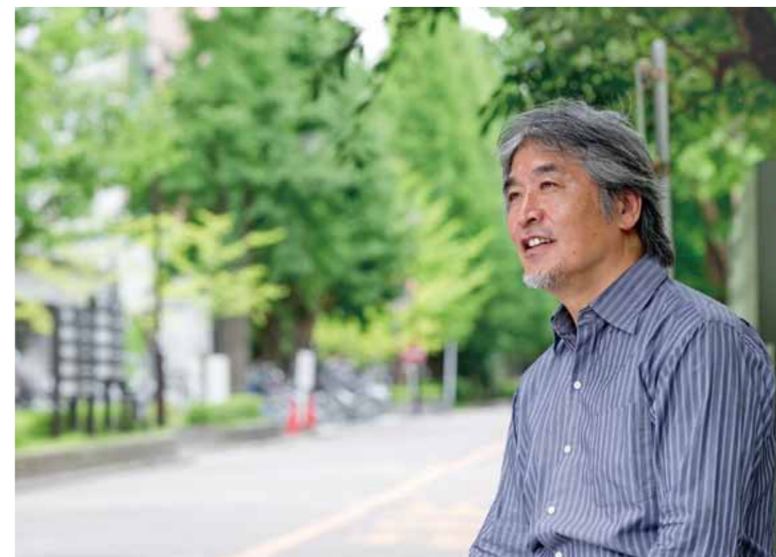
京都大学総長 山極 壽一

京都大学は創立以来、自由の学風のもと対話を根幹とした自主独立と創造の精神を涵養し、多角的な課題の解決に挑戦して、地球社会の調和ある共存に貢献すべく、質の高い高等教育と先端的学術研究を推進してきました。学問を志す人々を広く国内外から受け入れ、国際社会で活躍できる能力を養うとともに、多様な研究の発展と、その成果を世界共通の資産として社会に還元する責務は、ますます重要になりつつあります。