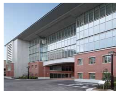
国際科学イノベーション棟

また、地域中核病院や自治体との連携の強化および海外特にアジア地域の病院との医療人材交流の一層の拡大を通じて、地域のみならずアジア諸国における国際標準の医療の提供を図ります。