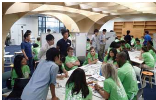
あしなが育英会「京都学インターンシップ・プログラム」