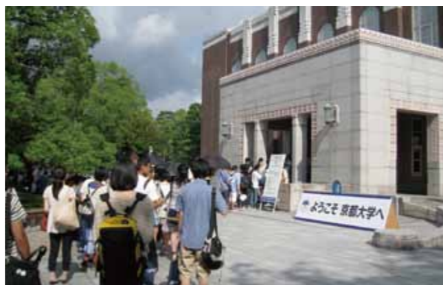
オープンキャンパス