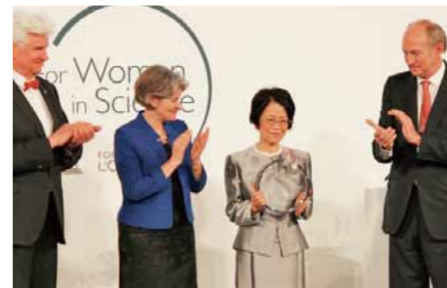
ロレアルーユネスコ女性科学賞を受賞