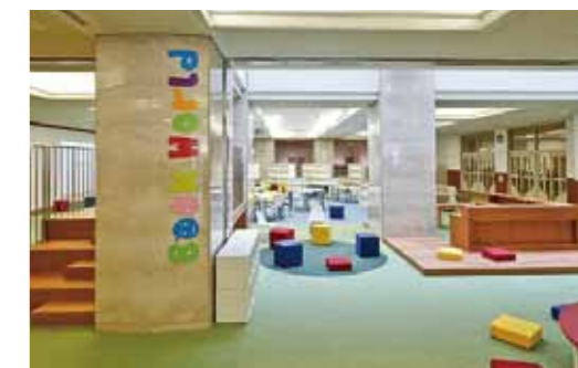
子どもたちと本学の研究室がデザインした京都市立洛央小学校「ブックワールド」