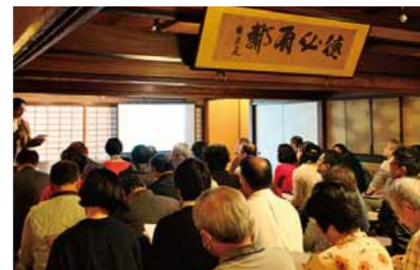
町家de春の京大トーク