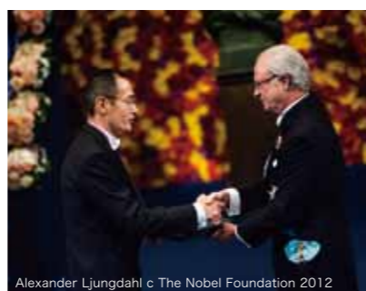
Alexander Ljungdahl © The Nobel Foundation 2012