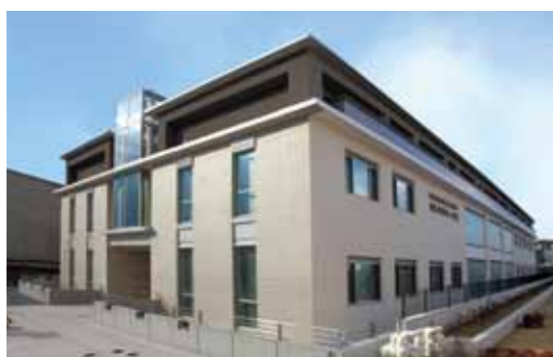
博士課程教育リーディングプログラムの拠点の一つとして整備した「京都大学東一条館」

WはWild and Wise。すなわち野生的で賢い学生を育てようという目標です。現代の学生は内にもりがちで、IT機器を常時持ち歩き、狭い仲間うちだけで絶えずつながりあう傾向にあると言われています。そのため、ひとりよがりの判断でよしとしてしまう風潮が広がりつつあります。理にかなう優れた選択や行動を実施するためには、情報を正しく読み、自分ばかりでなく他者の知識や経験を総動員して自己決定する意思を強く持つことが必要です。大学キャンパスの中はもちろんのこと、それ以外にもこうした対話と実践の場を多く設け、タフで賢い学生を育てようと考えています。