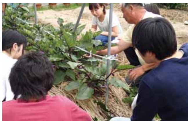
全学共通科目「京野菜の栽培を習う」での実習