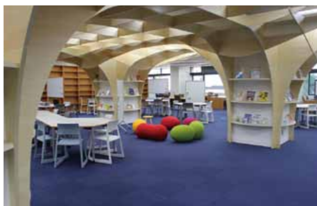
グループワークやディスカッション等が可能なスペース「ラーニング・commons」(附属図書館)