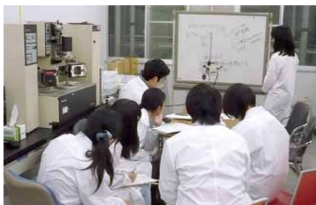
高校生を対象としたグローバルサイエンスキャンパス事業

○ はOriginal and Optimistic。これまでの常識を塗り替えるような発想は、実は多くの人の考えや体験を吸収した上に生まれます。そのためにはまず、自分が素晴らしいと感動した人の行為や言葉をよく理解し、仲間とそれを共有し話し合いながら、思考を深めていく過程が必要です。自分の考えに行き詰まったり、仲間から批判されて悲観しそうになったりしたとき、それを明るく乗り越えられるような精神力が必要です。失敗や批判に対してよくよせず、それを糧にして自分とは異なる考えを取り入れて成功に導くような能力を涵養しなければなりません。その機会を京都大学になるべくたくさん作るように環境を整えようと思っています。