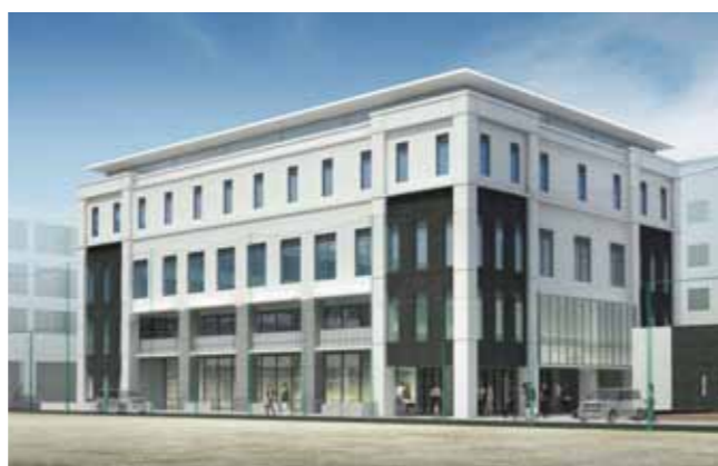
国際高等教育院附属国際学術言語教育センター(i-ARRC) (完成予想図)