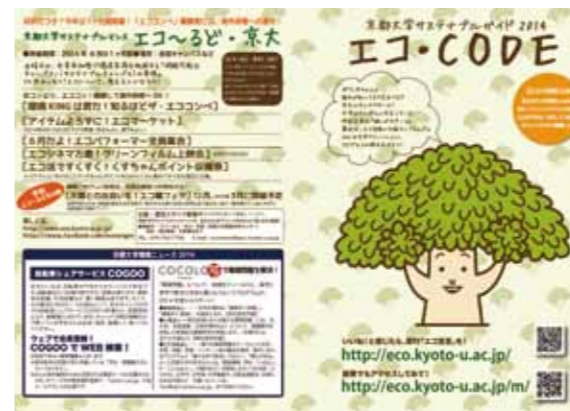
京都大学サステナブルガイド