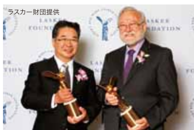
ラスカー基礎医学賞を受賞

「International and Innovative」は国際性豊かな環境の中で、常に世界の動きに目を配り、世界の 人々と自由に対話しながら、時代を画するイノベー ションを生み出そうとするものです。海外の大学や 研究機関、産業界等を通じた多様な交流を通じて、 これらの動きを作り出そうと考えています。