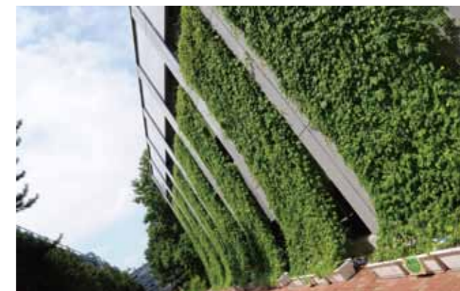
省エネを目指したグリーンカーテン