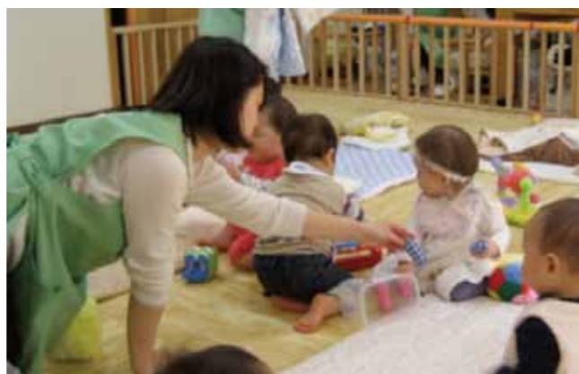
男女共同参画推進センター 保育園入園待機乳児保育室

WはWomen and Wish。これまで政府は男女共同参画社会の実現を目指し、数々の対策を奨励してきました。京都大学も学生に占める女性の比率は2割を超え、事務職員・技術職員では6割近くになりましたが、教員はまだ1割近くに留まっています。この比率は徐々に上昇すると思いますが、まずは女性が働きやすく、勉学に打ち込める環境作りが必要です。出産・育児休暇が男女とも取りやすく、それが仕事や勉学を継続する妨げにならないような仕組みや、女性に優しい施設・システムづくりを考えていきます。男女共同参画を支える環境・支援体制整備に加え、休業から復帰後の子育て期に柔軟な働き方を選べる制度を構築するため、男女共同参画推進アクション・プランを作成し、その事業推進に努めます。