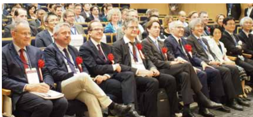
京都一ボルドー シンポジウム2015