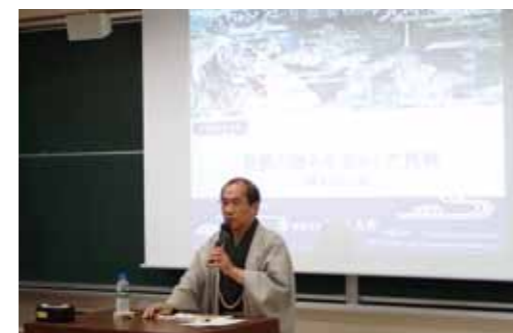
ゲストスピーカーによる講義「京都の強みを生かした挑戦」