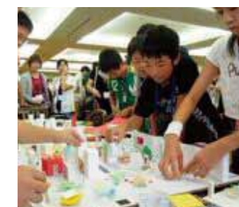
「ブックワールド」の模型を製作する6年生の子どもたち