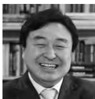
シン・ドンヨウ 韓国延世大学 ビジネススクール 教授