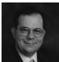
ロバート・デフィリッピ 米国サフォーク大学 教授