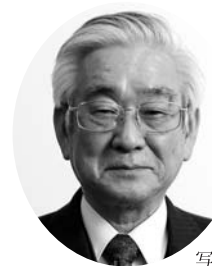
写真：益川名誉教授