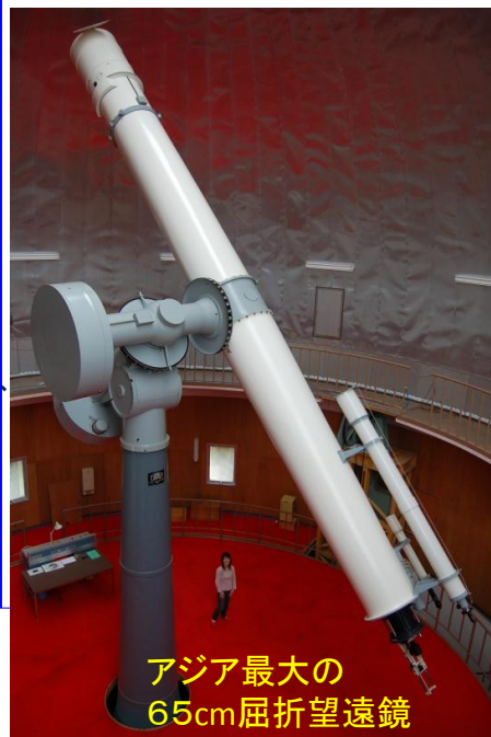
アジア最大の 65cm屈折望遠鏡