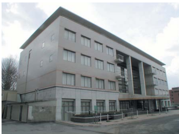
学術情報メディアセンター南館（OSL）建物

また，教育用コンピュータシステムではPCやファイルサーバ，プリンタなどは限られた資源を多くの利用者が共同で利用しています。他の利用者に配慮し，許された利用条件の範囲で有効に利用してください。設備やソフトウェアは貸借物品ですので大切に扱ってください。機器やソフトウェアについては保守や更新を行っていますが，必ずしも個人の希望に沿った新規導入などができるわけではないことにもご理解ください。