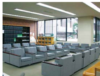
1階新聞閲覧コーナー