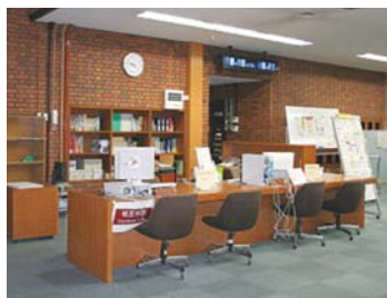
1階メインカウンター