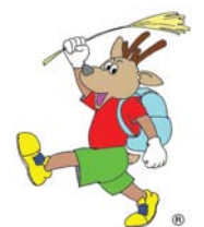
マスコットキャラクター "そにっと"