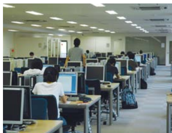
3階情報端末エリア