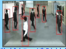
人物検知・追跡技術