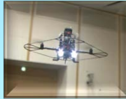
小型飛行監視ロボット