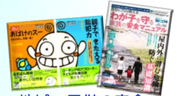
地域・子供の安全