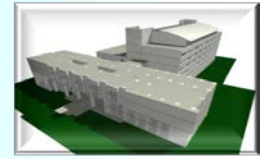
空間エンジニアリング (BIM)