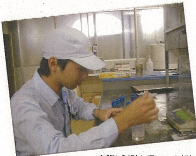
実際に試験も行っていただきます。