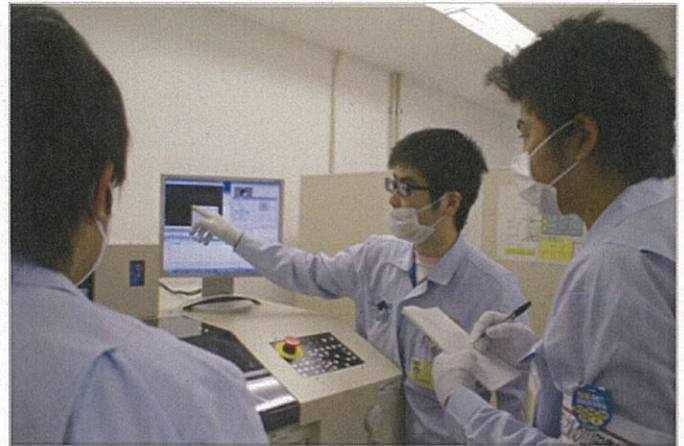
先輩社員が丁寧に教えます。