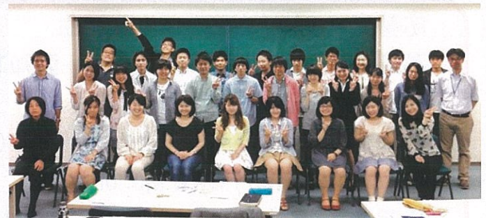
キックオフミーティング

環境会議所東北 仙台いぐね研究会 みやぎ・環境とくらし・ネットワーク(MELON)