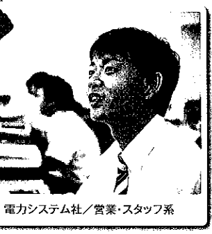
電力システム社/営業・スタッフ系

Album 4 東芝のイメージは、企業規模が大きくブランド力が強いまさに大企業、社風は堅く社員の方々も冷静でプライドが高いのではないかと思います。でも実際に感じたのは、何よりも人が魅力的だということです。みなさんの情熱的な仕事ぶりからは「仕事を愛し、仲間を愛し、会社を愛する」という社風が伝わってきて、そこにはまさに私の憧れる社会人の姿がありました。