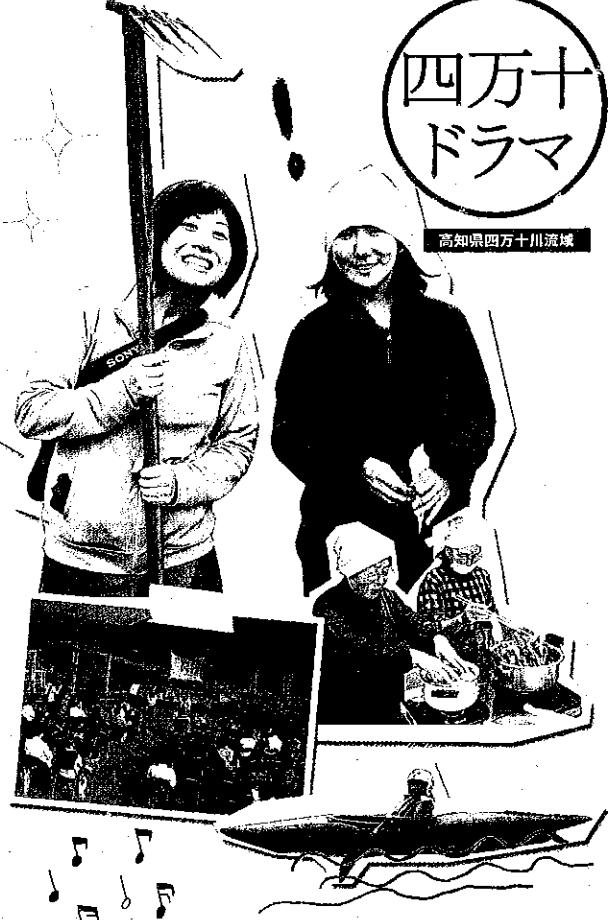
高知県四万十川流域