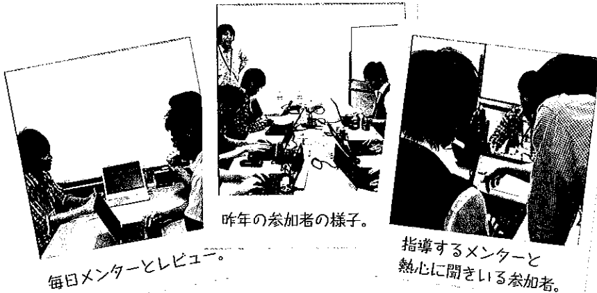
毎日メンターとレビュー。