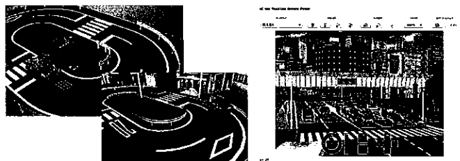
UC-win/Road 3次元リアルタイムVRソフトウェア

【開発・技術】当社製品の開発(開発言語Delphiなど)、当社製品に関わる技術サービスおよび、ネットワークシステムの技術開発など 【営業・事務】当社製品の販売、エンジニアリングセールス、E販売 3次元VRシミュレーション、土木設計・構造解析プログラムの開発／販売。高い技術力と実績で安定した独立系IT企業です。 海外からのインターンシップを含め、受け入れを積極的に行っており、卒業後、正社員として活躍しております。