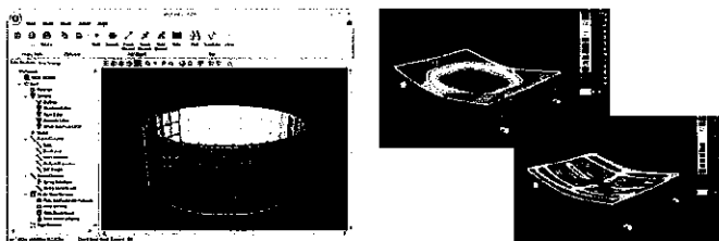
Engineer's system 3次元プレート動的非線形解析