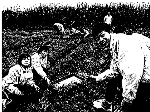
関西・菜の花植え付け