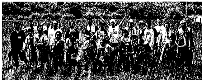
関東・田んぼの体験活動

※CSO(Civil Society Organization: 市民社会組織) = NPO・NGO