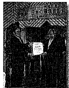
環境首都コンテスト表彰式の様子（水俣市）