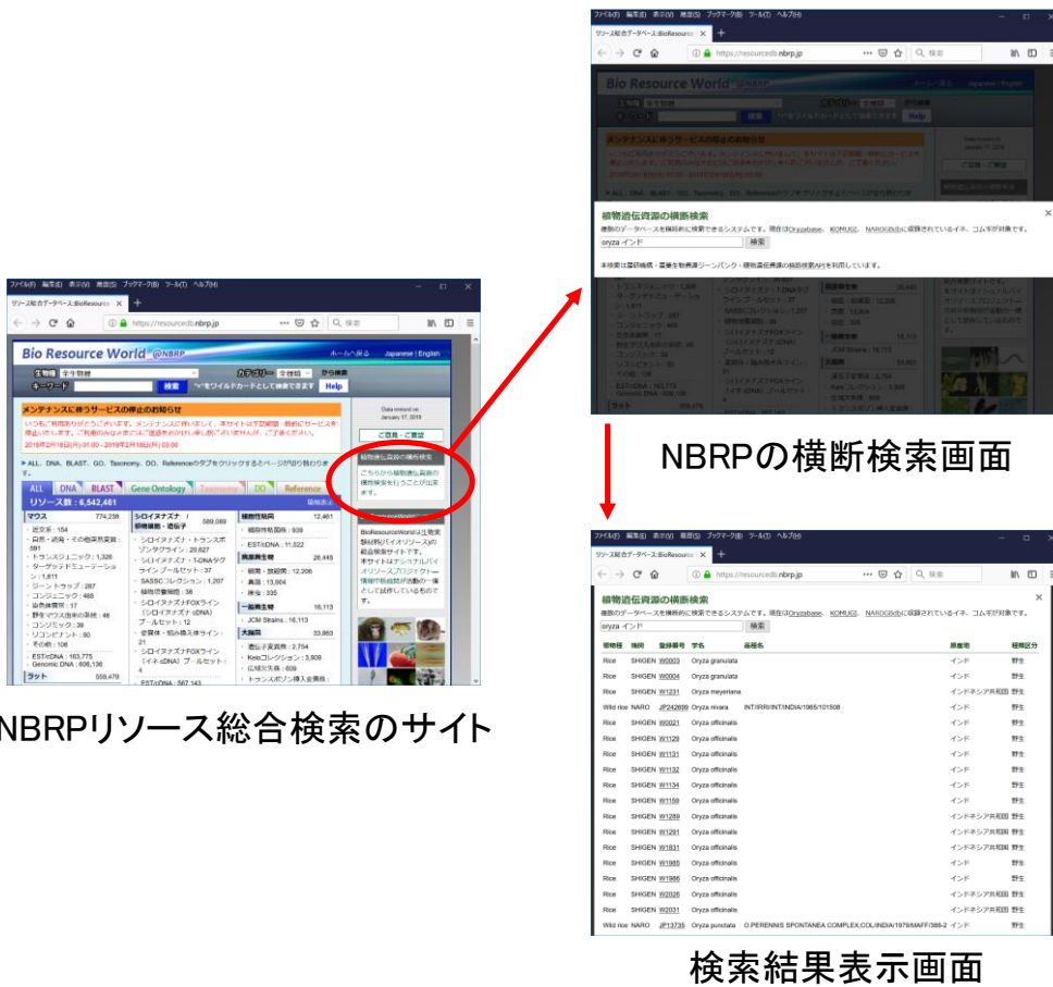
NBRP リソース総合検索のサイト