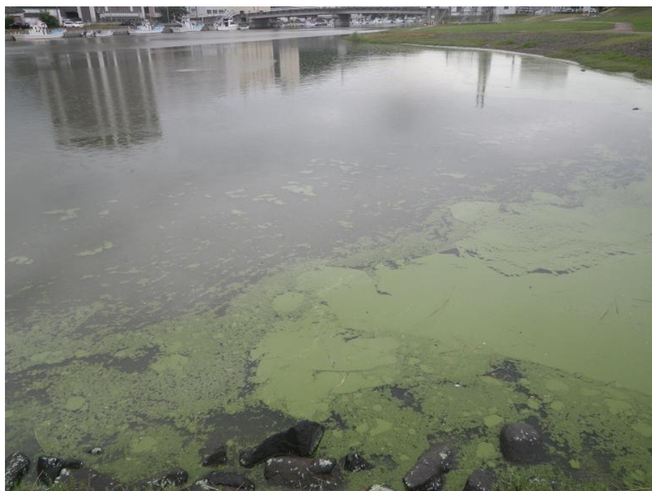
図2 汽水で出現したアオコ（網走湖から流出する網走川、2017年）