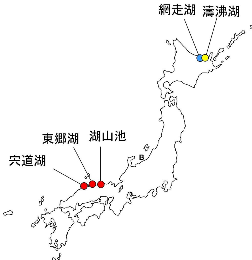
図4 日本の汽水湖における塩分耐性アオコの分布 色の違いは異なる遺伝子型（ミクロシスティスの個体の違い）を表す。