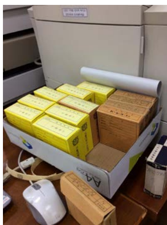
図1：奎章閣研究所の刑事司法に関する一部のマイクロフィルム

この度、本学の支援助成をいただき、事前に計画していた以上の資料を閲覧・複写することができた。今回韓国での資料で得た資料によって、朝鮮王朝末期から朝鮮総督府まで刑事法の変遷並びに監獄の実践を明らかにするという当初の目的に加え、植民地期の刑事裁判記録を分析を通して、植民地朝鮮の刑事法制の解釈と適用実態を解明できると考える。今後調査で得た資料をもって論文を執筆していく予定である。