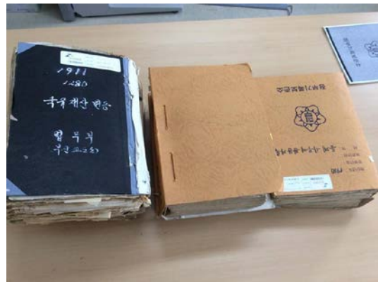
图4：国家記録院の太田本館に所蔵されている植民地期朝鮮の刑事司法に関する資料の原本