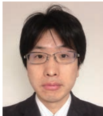
林 隆之 教授

日本学術会議副会長、奈良女子大学副学長・研究院生活環境科学系教授。専門はジェンダー法学、ジェンダー史、比較法文化論。2017年6月に日本学術会議第一部から出された提言「学術の総合的発展をめざして—人文・社会科学からの提言—」の取り纏めをおこなう。