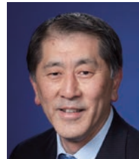
田中 愛治 教授

オックスフォード大学ニッサン現代日本研究所及び社会学科教授。専門は現代日本社会論、社会学。教育、社会階層・社会移動、戦後日本の社会変容に関する社会学研究を進める。日本の教育・大学制度に関して多方面から発言。論文・著書多数。近著に「オックスフォードからの警鐘—グローバル化時代の大学論（中公新書ラクレ）」。