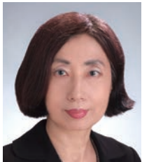
三成 美保 教授

日本学術会議副会長、奈良女子大学副学長・研究院生活環境科学系教授。専門はジェンダー法学、ジェンダー史、比較法文化論。2017年6月に日本学術会議第一部から出された提言「学術の総合的発展をめざして—人文・社会科学からの提言—」の取り纏めをおこなう。