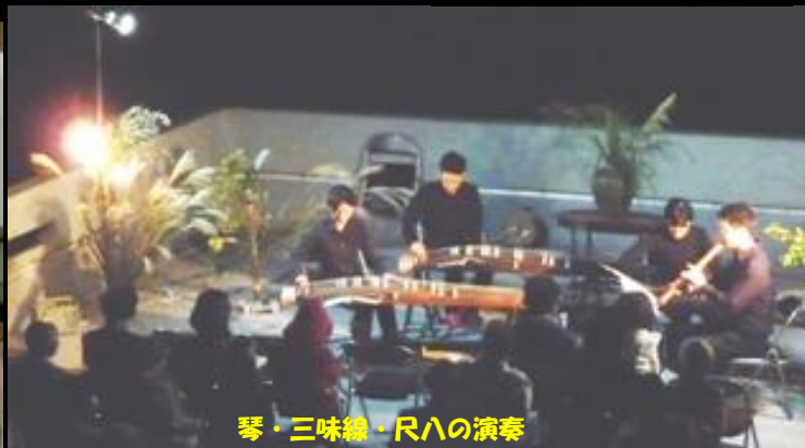
● 琴・三味線・尺八の演奏

■ 日 時: 2018年 9月24日 (月・祝日) (A) 18:30~20:00, (B) 19:00~20:30, (C) 19:30~21:00, (D) 20:00~21:30 ■ 会 場: 京都大学大学院理学研究科 花山天文台