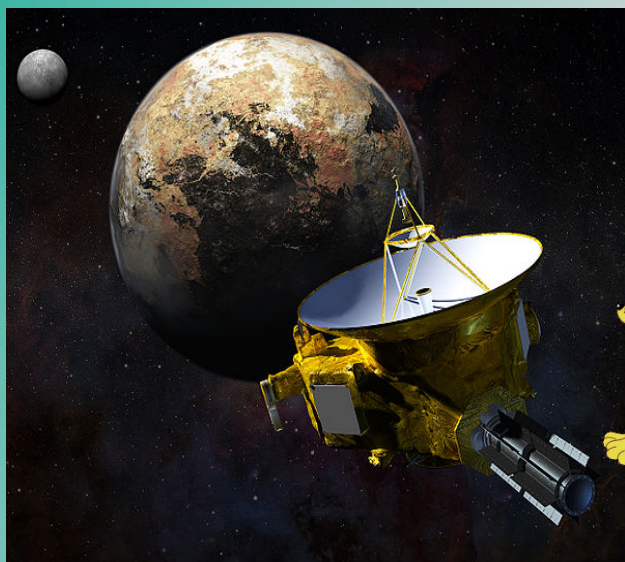
冥王星に近づくニューホライズン

身体障害者手帳をお持ちの方、70歳以上の方は入館料無料(年齢確認ができるものをご提示ください。)