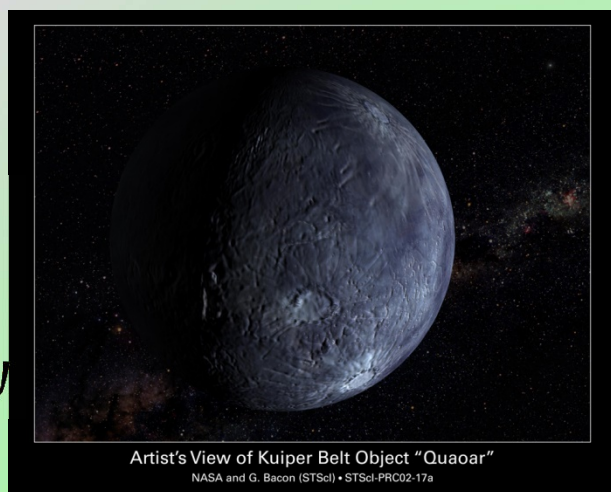
太陽系外縁の星の想像図