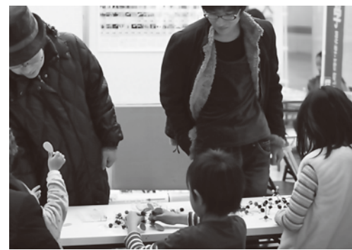
*写真は、イメージです。