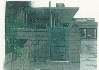
本部構内正門配置サイン