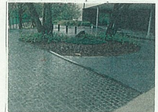
医学部芝蘭会館アプローチ