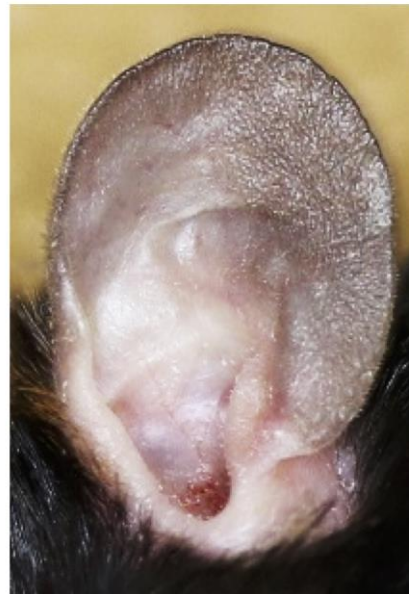
TRAF6が皮膚の表面の細胞にないマウスの耳