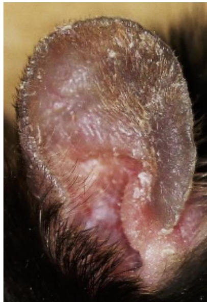
乾癬を発症したマウスの耳

本研究成果は、2018 年 8 月 9 日に米国の国際医学誌「JCI インサイト」のオンライン版に掲載されました。