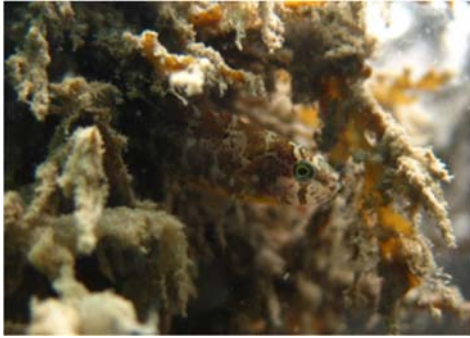
泥をかぶった海藻に隠れるタケギンポ。津波から2ヶ月後の2011年5月。

掲載誌: PLOS ONE ( http://dx.plos.org/10.1371/journal.pone.0168261 )