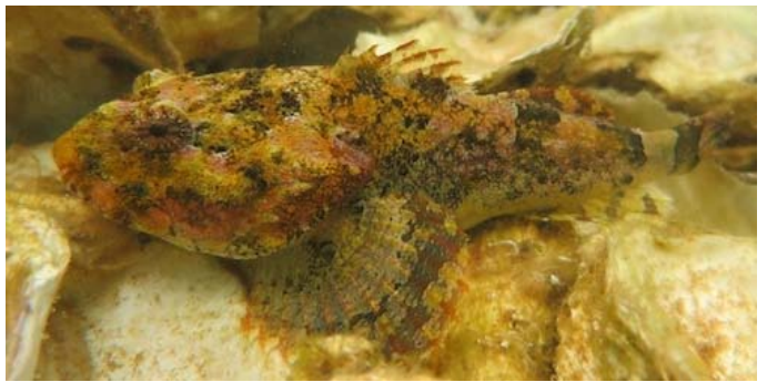
北方種であるトゲカジカの出現。2014年5月。