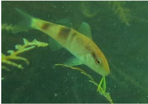
南方種であるオジサンの出現。2012年9月。