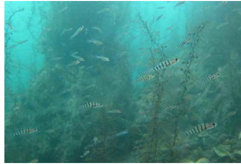
津波から1年以内はキヌバリが優占。2011年11月。