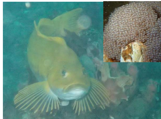
卵を保護するアイナメ。右上は卵の拡大写真 2014年11月。