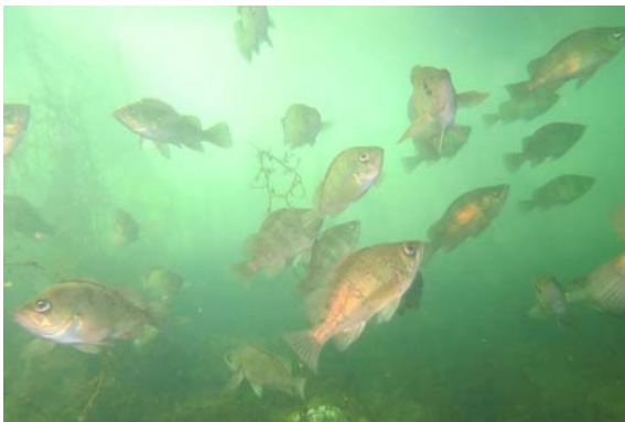
シロメバルの群れが復活。2014年7月。