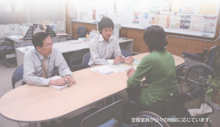
支援室員が日々の相談に応じています。