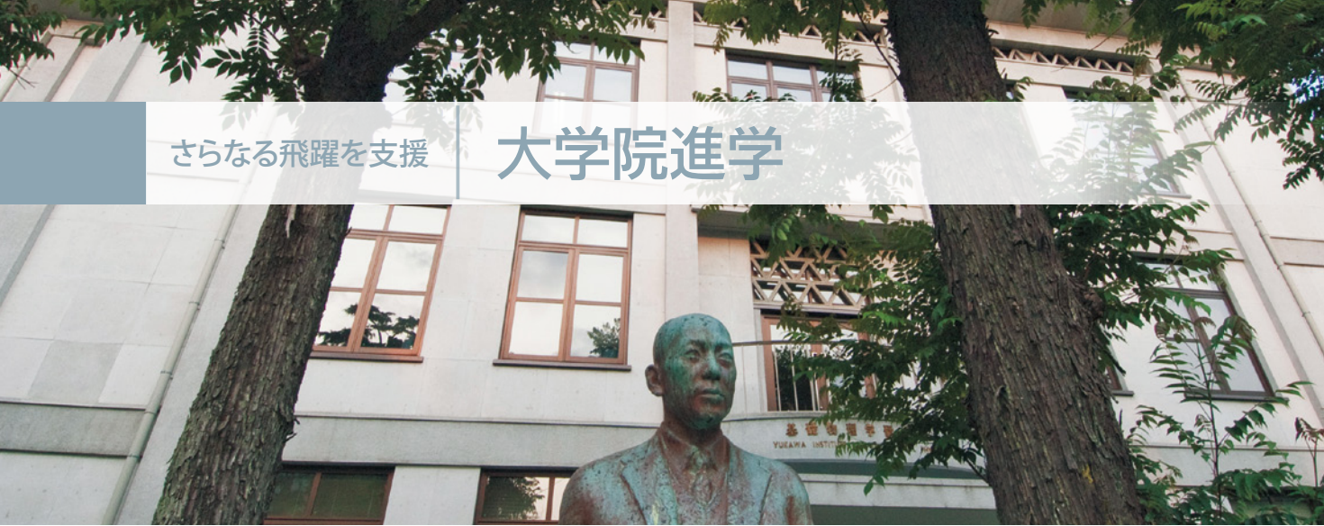
【写真】 湯川記念館 湯川秀樹博士像