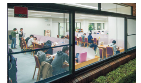
[写真] 学習室 24