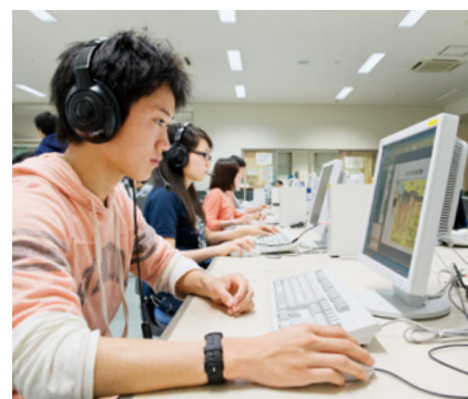
[写真] CALL 自律学習用端末の利用風景