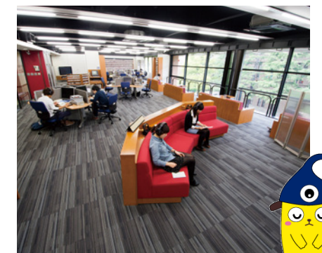
[写真] メディア・コモンズ (Media Commons)