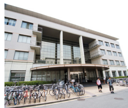
[写真] 学術情報メディアセンター南館