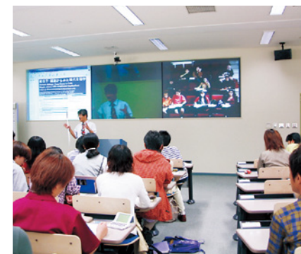
[写真] 国際遠隔講義風景