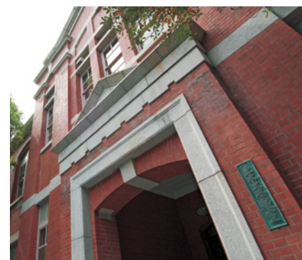
【写真】 土木工学教室

※学部ごとの進路状況については、学部紹介のページ(22ページから65ページ)をご参照ください。