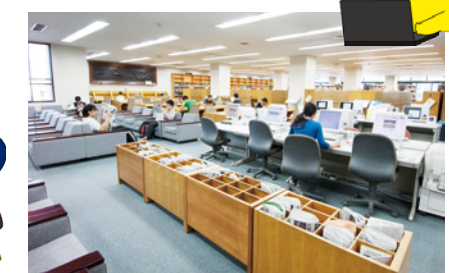
[写真] 新聞コーナー