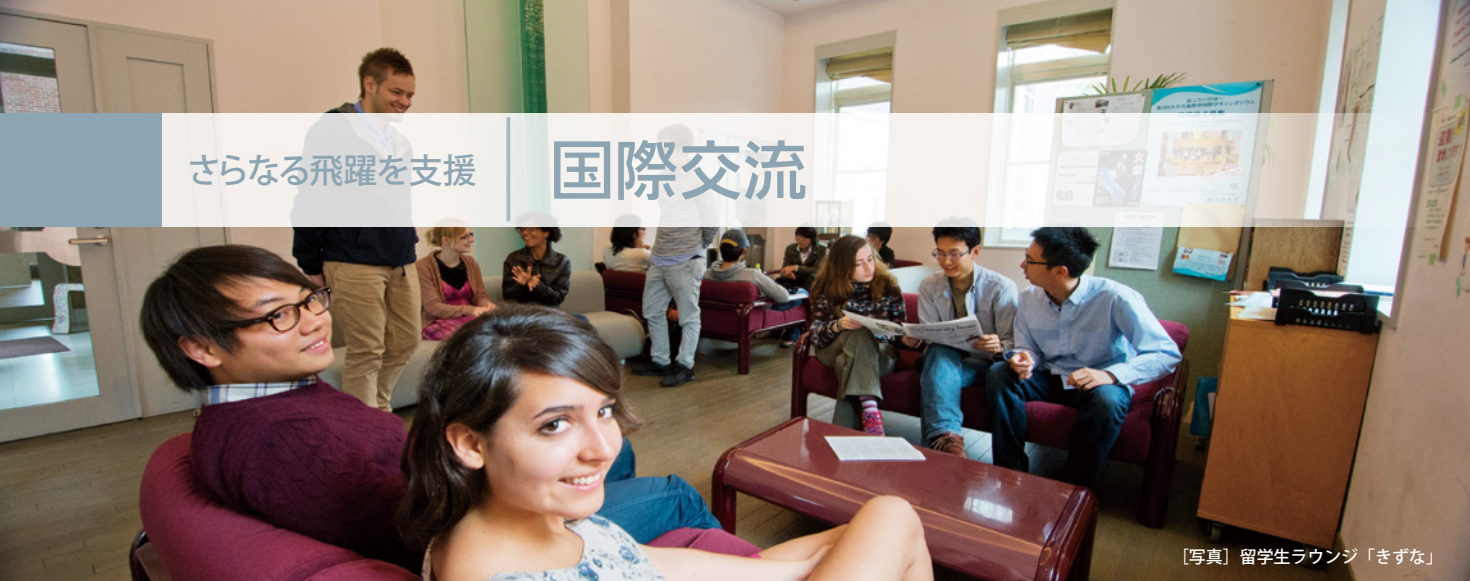
【写真】留学生ラウンジ「きずな」