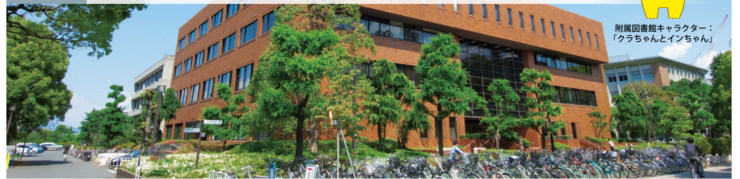
附属図書館キャラクター：「クラちゃん」と「インちゃん」