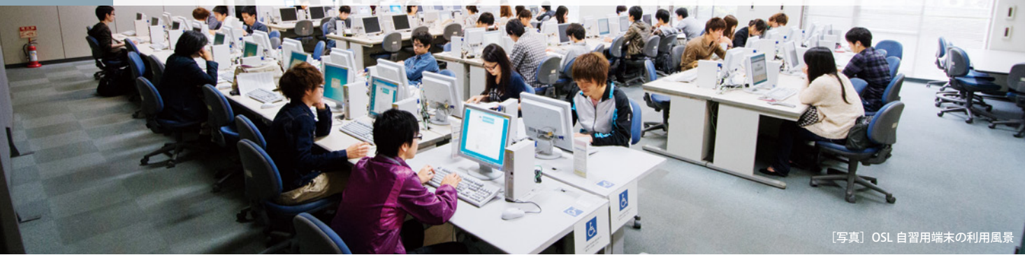
[写真] OSL 自習用端末の利用風景

ダイナミックに変化する情報環境において、実社会で即戦力となる人材の育成と、情報処理の基礎教育に取り組んでいます。