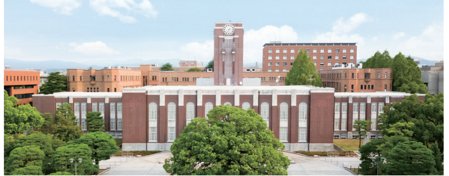
現在の吉田キャンパス(百周年時計台記念館)

明治30年6月18日、勅令第209号が制定され、京都帝国大学が創立されました。最初は理工科大学が置かれ、続いて数年のうちに法科大学、医科大学、そして文科大学が置かれました。大正8年、「大学令」が施行され、京都帝国大学でも、法・医・工・文・理の各分科大学が学部改称されました。昭和22年、「帝国大学令」が改正され、「帝国大学」は「国立総合大学」と改められることになり、京都帝国大学も京都大学に改称されました。戦後、教育改革によって新たな教育制度が導入され、昭和24年、京都大学も、第三高等学校と附属医学専門部を包括して新制大学としてのスタートを切りました。一般教育も開始され、京都大学は宇治と吉田に分校を設置してこれに当たることになりました。 平成15年、「国立大学法人法」が施行され、平成16年に国立大学法人京都大学が発足しました。国の組織から制度上独立し学長の権限を強化することで、弾力的な大学運営及び教育研究の活性化につながるとされ、学外者を含めた学内管理体制が整備されました。 長い歴史の中で京都大学は、常に社会と共にあり、教育研究の改革・発展に挑み、京都の地で豊かな人材を輩出し続けています。