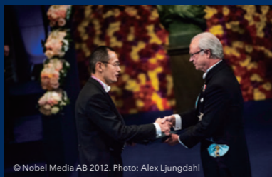
山中伸弥教授 ノーベル賞授与式