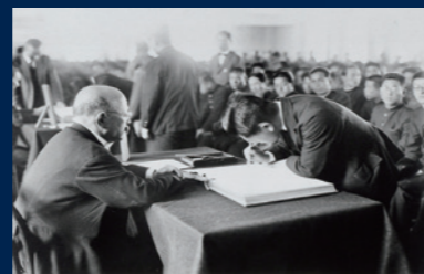
大学院入学宣誓式の様子(1928)