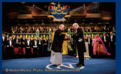
本庶佑特別教授 ノーベル賞授与式