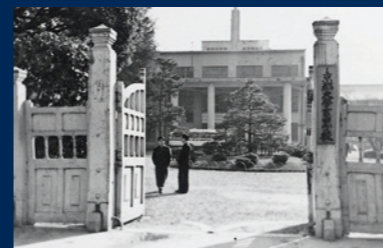
分校正門(現在の吉田南構内)