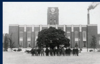
時計台前の学生たち(1928年頃)