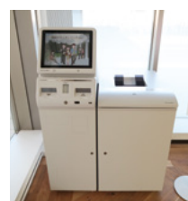
証明書自動発行機

月曜日から金曜日の、8:30から18:00までを基本としていますが、設置場所により異なっていますので、注意してください。また、次に掲げる日は稼働していませんので注意してください。