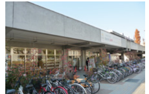
⑫カフェテリアルネ ショップルネ