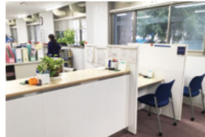
⑨教育推進・学生支援部学生課奨学掛