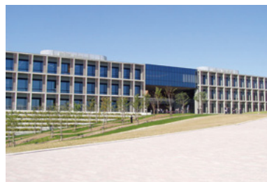
⑥3 工学研究科大学院掛・留学生掛