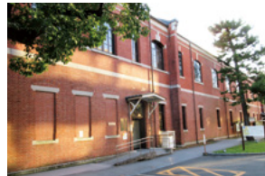
⑩教育推進・学生支援部棟 (P12フロアマップ)